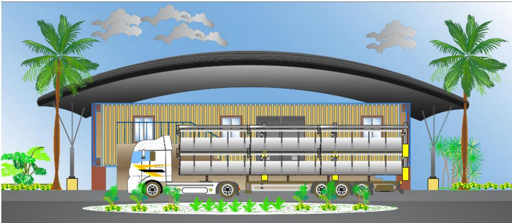
Figura 1: Plano del furgón