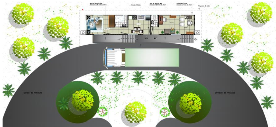
Figura 5: Planta arquitectónica